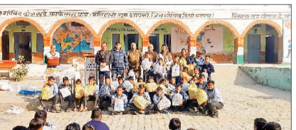
खरखोदा। जरूरतमंद बच्चों को जूते व वर्दी वितरित करते समाजसेवी।