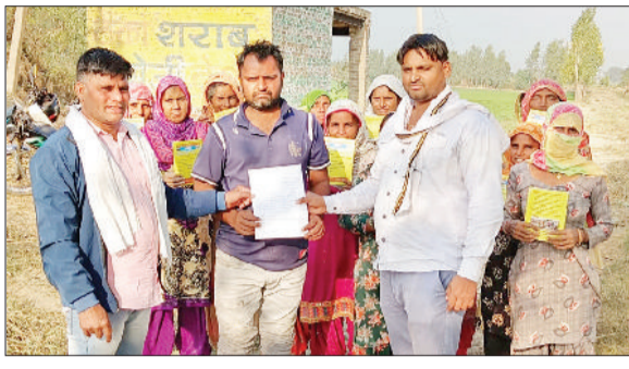
बकाया पारिश्रमिक का भुगतान करने की मांग करते मनरेगा श्रमिक।