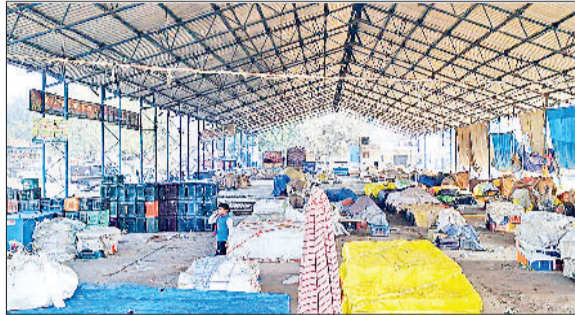
सोनीपत। मंडी के अंदर बंद का दिख रहा असर तथा शैड के नीचे खाली पड़ी दुकानें।