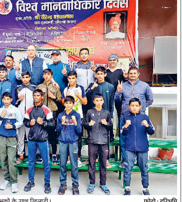
खरखोदा। कैप के समापन पर प्रशिक्षकों के साथ खिलाड़ी।