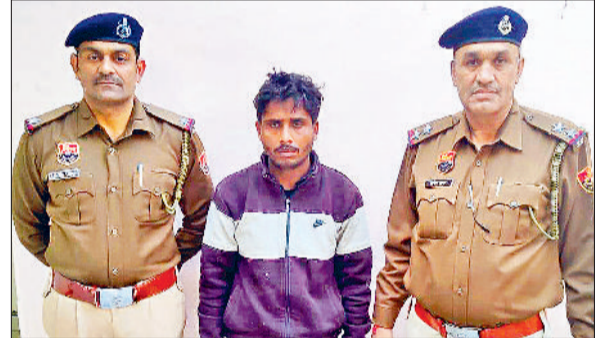
सोनीपत। गिरफ्तार आरोपित पुलिस टीम के साथ।