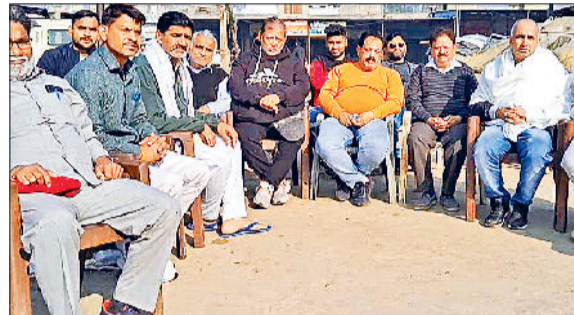
खरखोदा। हड़ताल का समर्थन करते आदती।

उनकी मांग को पूरा नहीं किया तो 1 जनवरी से प्रदेश की 114 सब्जी मंडियों में अनिश्चितकालीन हड़ताल शुरू की जाएगी।