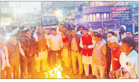
गोहाणा। राहुल गांधी का पुतला दहन करते भाजपा नेता और कार्यकर्ता।